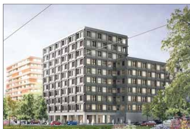
Auf dem Suurstoffi-Areal entsteht ein Bürogebäude in Holz-Beton-Verbundbauweise. Mit zehn Geschossen bei 36 m Höhe ist es das erste Holz-Hochhaus der Schweiz. Die Fertigstellung ist für 2018 geplant.

Da das Holzbaunehmen von Beginn an in die Planung miteinbezogen worden war, konnten viele der von den Vorrednern genannten Kriterien für eine intelligente und hocheffiziente Planung berücksichtigt werden. Verknüpft mit ausgereifter Architektur und dem Mut zu Neuem, ermöglichte das eine Bauzeit von nur zehn Monaten. Die Zeitersparnis gegenüber einer herkömmlichen Bauweise lag laut Bauherr bei acht Monaten.