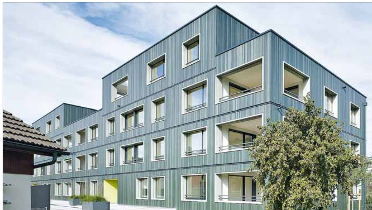
Das erste „Swisswoodhouse“ ist in Nebikon (Schweiz) entstanden. Ausgangslage des Konzepts ist ein Raum von 18 m 2 . Für dieses Raummodul wurde ein Katalog mit verschiedensten Nutzungen entwickelt. Nach der industriellen Vorfertigung konnte das Gebäude auf der Baustelle in drei Wochen errichtet werden.

Die Hochhaus-Rallye setzte Rune Abrahamsen von Moelven Limtre in Moelv, Norwegen, fort: Unter dem Namen „Mjøstårnet“ stellte er die Konstruktion eines 81 m hohen Holzhochhauses im norwegischen Brumunddal