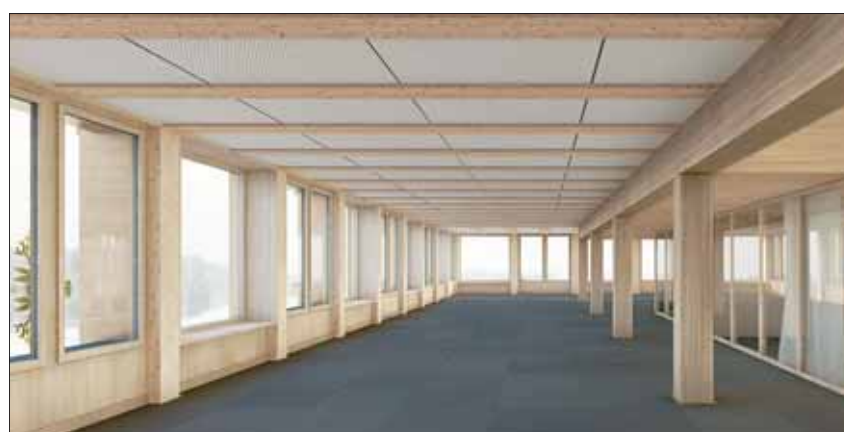
Der Skelettbau aus Buchenholz-Stützen und -Trägern bzw. das Tragsystem der Buchenholz-Beton-Verbund-Decken bleibt nach Fertigstellung im Innenraum sichtbar, wie auch die in der Fassadenebene liegenden Stützen aus Fichte oder Tanne.