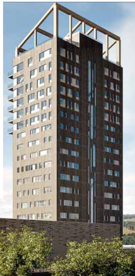
Der rund 80 m hohe „Mjøsa Turm“ im norwegischen Brumunddal soll nach Abschluss der Bauarbeiten im März 2019 das höchste (reine) Holzgebäude der Welt sein.

Visualisierung: Voll Arkitektur AS-Eve Images