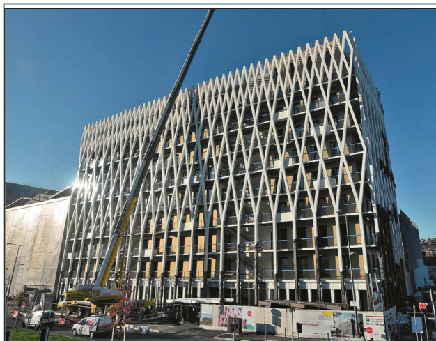
Eine ornamentale Doppelfassade erzeugt einen hohen Wiedererkennungswert sowie Sonnen- und Sichtschutz. Dazwischen gefügte Stege erlauben es, die Hauptfassade zu warten und die Fenster von außen zu putzen.