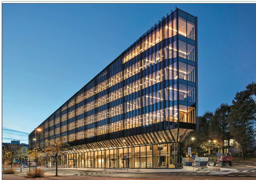
Die nördliche Spitze des dreieckigen Bürogebäudes der Sparebank in Stavanger markiert den höchsten Punkt des Sechs- bzw. Siebengeschossers (wenn man den zweigeschossigen Eingangsbereich als zwei Geschosse zählt). Er nimmt nach hinten an Höhe ab.

Lifteam aus Paris (Frankreich) seinen eigentlichen Vortrag über das mit 35 m derzeit höchste Bürogebäude aus BSP des Landes, den „Palazzo Méridia“ in Nizza, ein. Das Spektrum reichte vom Sechsgeschosser „Docks libres“ und dem Studentenwohnheim „Crous Lucien Cornil“, beide in Marseille, über das achtgeschossige Bürogebäude „Opalia“ bzw. die beiden siebengeschossigen Büro- und Geschäftshäuser „Green Office Enjoy“ und „Pulse“, beide in Paris, schließlich zum zehngeschossigen „Palazzo“. Der Bürobau ist 55 m lang und 17 m tief. Neun der zehn Geschosse sind in Holzbauweise ausgeführt, Untergeschoss, Erdgeschoss und die beiden Treppenhäuser dagegen be-