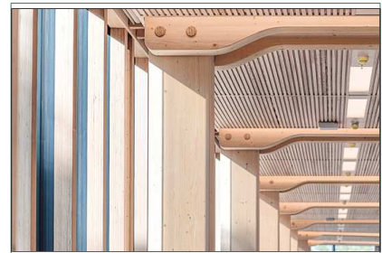
Die charakteristische, von Hermann Blumer entwickelte, organische Ausformung der Träger und Knoten mit den sichtbaren „Baubuche“-Dübeln ist Markenzeichen des Bankgebäudes.

übertragen können. Die BSP-Gebäudehülle trägt nicht zur Aussteifung der Konstruktion bei. Die markante Doppelfassade sorgt außer für einen hohen Wiedererkennungswert auch für Sonnen- und Sichtschutz.