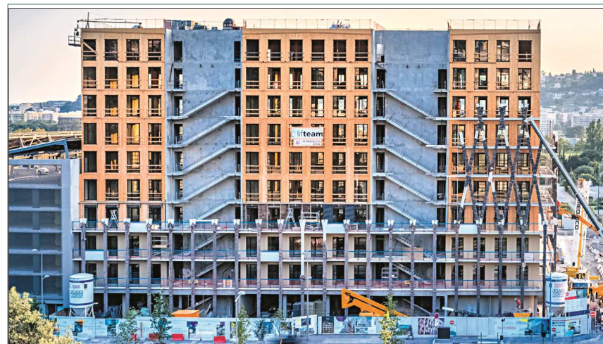
Neun der zehn Geschosse des 35 m hohen und 55 m breiten Bürobau „Palazzo Méridia“ in Nizza sind in Holzbauweise ausgeführt. Die beiden Stahlbeton-Treppenhäuser dienen der Holzkonstruktion als Aussteifung.

► Einen Bericht über dieses Projekt finden Sie auf Seite 82 dieser Ausgabe. Susanne Jacob-Freitag, Karlsruhe