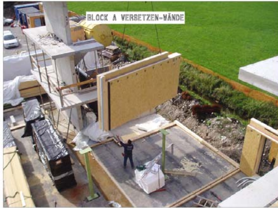
Abbildung 3: Block A ... Fundamentarbeiten Abbildung 4: Block A ... versetzen der Wände