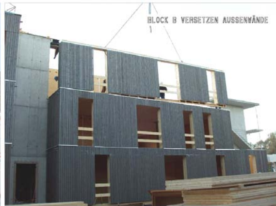
Abbildung 11: Block B versetzen der Wände