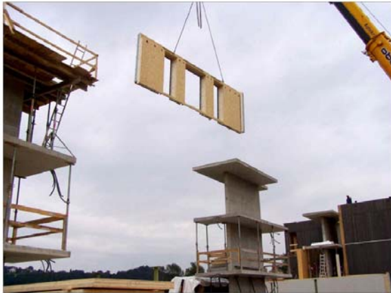
Abbildung 12: Block B versetzen der Wände