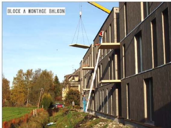
Abbildung 13: Block A einhängen der Balkonelemente