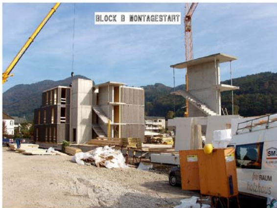
Abbildung 10: Block B versetzen der Wände