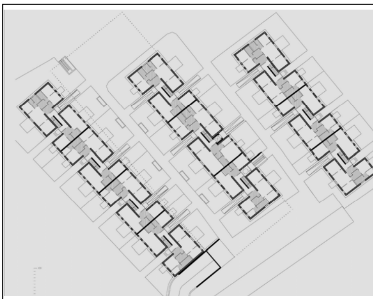
Abbildung 1: Lageplan

Das Gelände durchzogen Furchen vom Fluss zum Moor hin annähernd in Nordrichtung. Auf diese Furchen bezog sich der Architekt mit den kluftartig-lichtdurchfluteten Erschließungs- bzw. Stiegenzonen. Diese bilden Durchwegungen, die sich quer zu den langen Baukörpern durch die ganze Anlage schlängeln. Zu Rhythmisierung und Auflockerung der Gebäude tragen auch die Balkonloggien in den „Klüften“ bei. Sie bieten mit rund 11 Quadratmetern attraktive, halb geschützte, halb exponierte Freibereiche für die winkelförmig konzipierten Wohnungen. Die Baukörper bilden sich durch Ineinandersetzen dieser dreigeschossigen Wohnungs-Winkel unterschiedlicher Ausdehnung. Von den 60 Einheiten sind 24 Klein-, 21 Dreizimmer- und 15 Vierzimmerwohnungen. An die Küche im Zentrum der Wohnungen schließen beiderseits – durch Schiebetüren getrennt – Ess- bzw. Wohnbereich an.