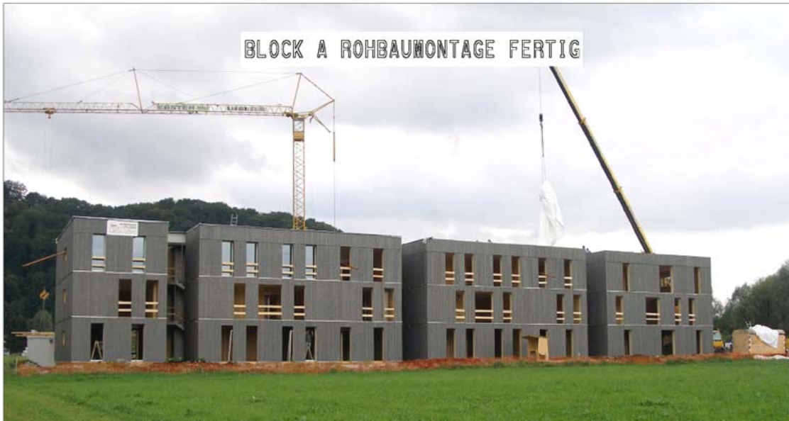
Abbildung 9: Block A Rohbaumontage fertig