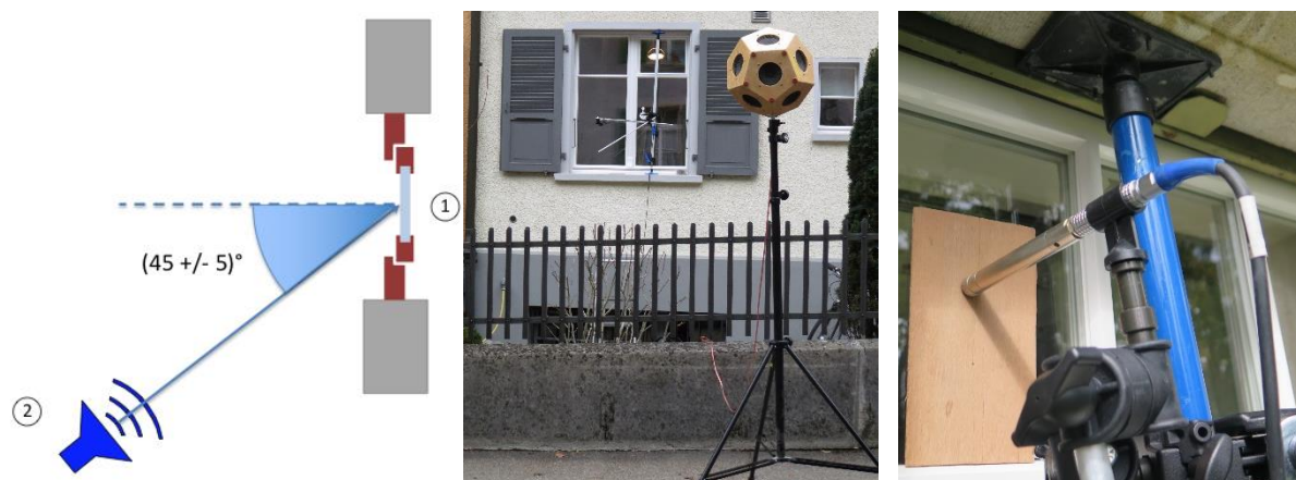
Abbildung 2: Links und Mitte: Messprinzip Bauteil-Lautsprecher-Verfahren nach EN ISO 16283-3 [5]; der Lautsprecher (2) wird außen so aufgestellt, dass die Schallwelle unter einem Winkel von (45 \pm 5)^\circ auf das Fenster (1) einfällt. Rechts: Positionierung des Mikrophons im Abstand von 3 mm außen vor der Verglasung mit Hilfe eines Abstandhalters.