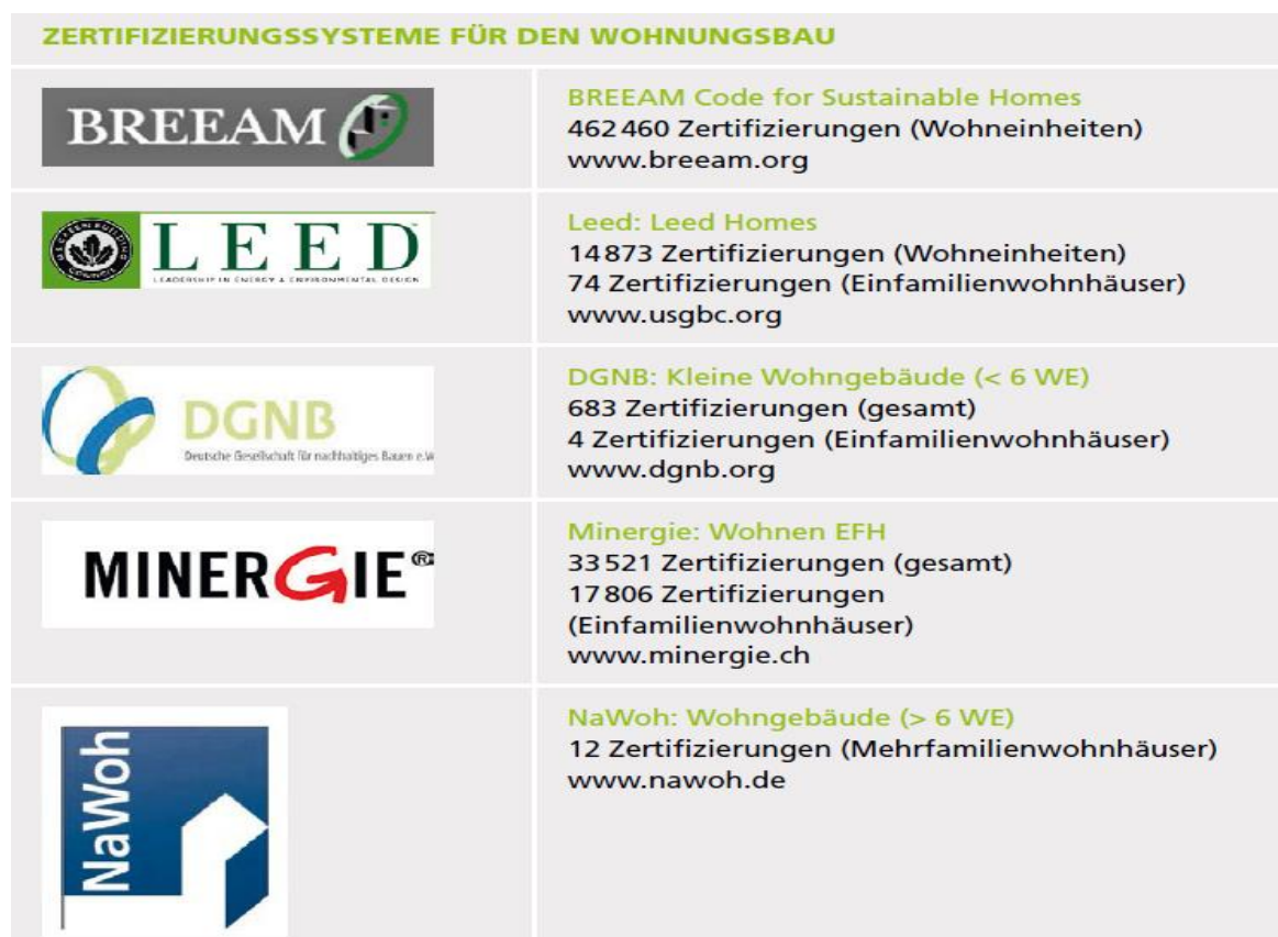
Abbildung 1: Nachhaltigkeitsbewertungssysteme für Gebäude

dem DGNB Zertifikat der Deutschen Gesellschaft für Nachhaltiges Bauen (DGNB) Gütesiegel auf den Markt, die im Gegensatz zu herkömmlichen Methoden nicht nur schwerpunktmäßig die Ökologie und Energieeffizienz von Gebäuden bewerten, sondern einen neuen ganzheitlichen und lebenszyklusorientierten Bewertungsansatz verfolgen. Das amerikanische LEED-System stellt aufgrund seiner erfolgreichen Marketing-Strategie zur Förderung des «Green-Building»-Konzepts derzeit weltweit das bekannteste Zertifizierungssystem dar. Mit derzeit rund 69.000 zertifizierten Gebäuden kommt es aber nicht an die internationalen Zertifizierungszahlen der britischen Methode BREEAM heran (USGBC 2015). Die hohe Bewertungsanzahl von BREEAM mit insgesamt etwa 500.000 zertifizierten Bauwerken resultiert daraus, dass die britische Regierung Nachhaltigkeitsstandards für das Bauwesen in Großbritannien gesetzlich vorgeschrieben hat (BREEAM 2015). Zu nennen sind hier der im Jahr 2006 beschlossene «Sustainable Procurement Action Plan», der eine verpflichtende Einhaltung des «BREEAM Excellent»-Standards bei allen Regierungsneubauten und –sanierungen fordert, oder der «The Code for Sustainable Homes». Dieser verlangt seit Mai 2008 die Einhaltung von Nachhaltigkeitszielen für alle Wohnungsneubauten und deren anschließende Bewertung.